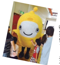
にこまむフィットネス

保険クリニック岩沼店オープン1周年、来店者数は延べ400組。 グリーンピア岩沼で開催された「にこまむフィットネス」に参加、 ゆるキャラ「IQくん」が登場。 ほかにも、亘理・岩沼等、県南のイベントなど参加。